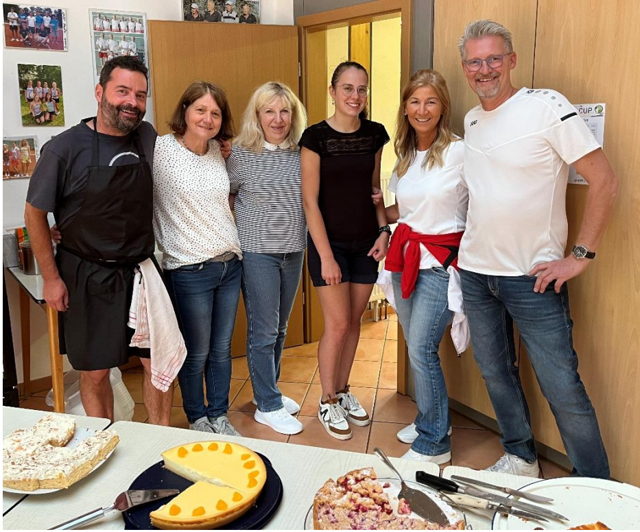
auch alle Helfer*innen hatten viel Spaß – vielen Dank

Ein Dankeschön auch an die fairen Teilnehmer*innen und die aktiven, begeisterten Fans trotz des regnerischen und ungewöhnlich kalten Wetters.